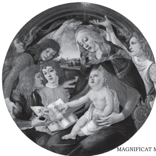
MAGNIFICAT MADONNA Sandro Botticelli

Áldott ünnepeket és sikeres, békés új esztendőt kíván a Szegedi Szimfonikus Zenekar!